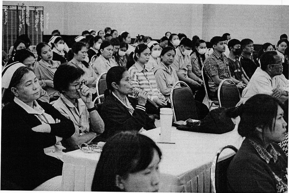
ระหว่างวันที่ 17-19 ธันวาคม พ.ศ. 2567