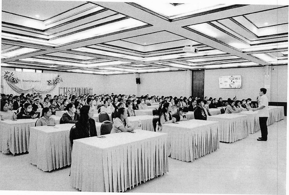
ภาพประชุมอบรมเจ้าหน้าที่โรงพยาบาลกุมภวาปี ๑๐๐%