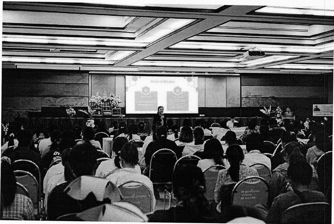
ระหว่างวันที่ 17-19 ธันวาคม พ.ศ. 2567