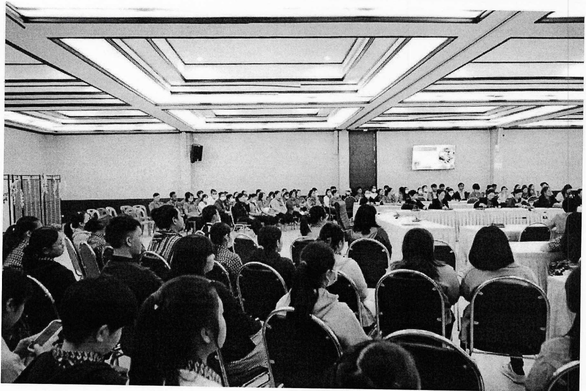
ระหว่างวันที่ 17-19 ธันวาคม พ.ศ. 2567